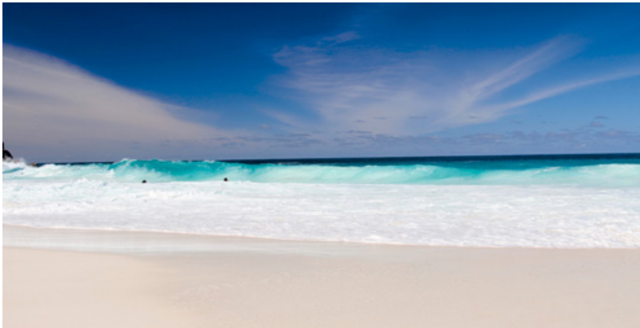
Medan turisterna njuter av Seychellernas paradisliska stränder bubblar gamla oförrätter under ytan.